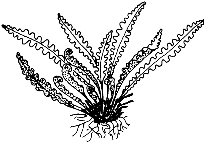
Ceterach officinarum Lam. et DC.

Répartition de Ceterach officinarum Lam. et DC. en France (maille de 20 km.) (D'après Dupont 1979)