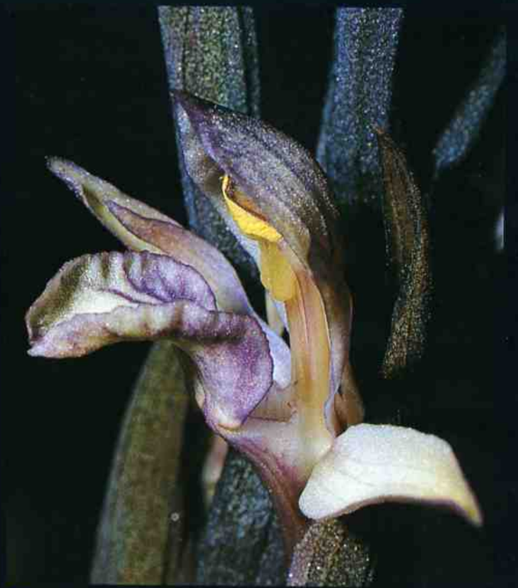
▲ Limodorum abortivum ▼ Cephalanthera longifolia