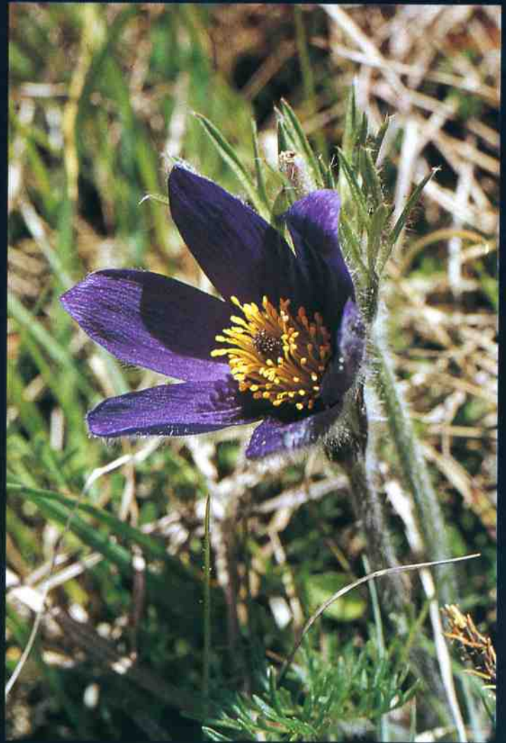
▲ Pulsatilla vulgaris ▼ Corydalis solida