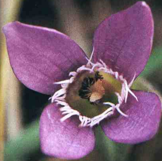
▲ Gentianella germanica ▼ Eriophorum angustifolium