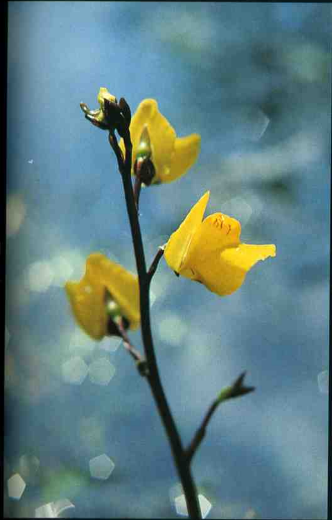
▲ Utricularia vulgaris