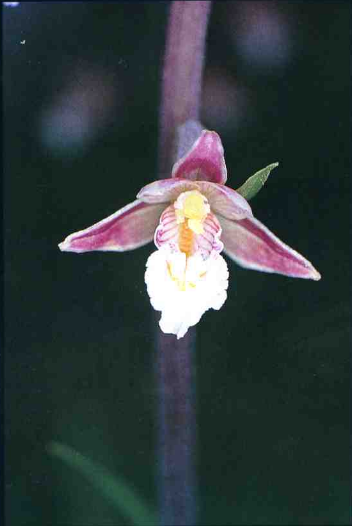
▲ Epipactis palustris ▼ Gentiana pneumonanthe