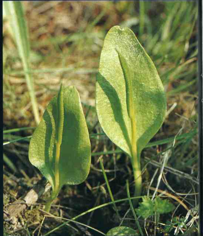
▲ Ophioglossum vulgatum ▼ Anacamptis pyramidalis