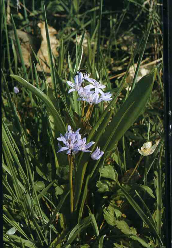
▲ Scilla bifolia ▼ Osmunda regalis