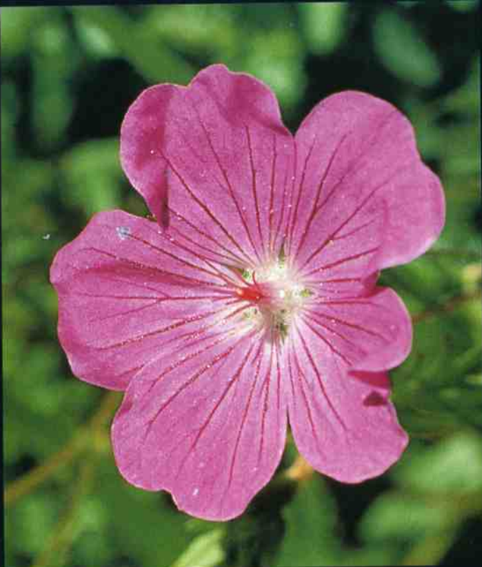
▲ Geranium sanguineum ▼ Ranunculus lingua