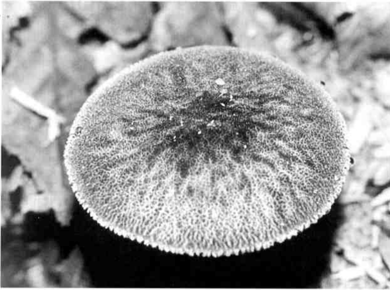
Photo 2 : Pluteus umbrosus (Pers. : Fr.) Kummer. Remarquer la marge ciliée du chapeau . x 1.

Soc. Amis Mus. Chartres Nat. Eure-et-Loir : Bull., C. Divet, Un champignon rare, Pluteus umbrosus (Pers. : Fr.) Kummer, découvert dans le bois de Lèves (Eure-et-Loir), 1995, 15 : 7-8