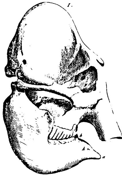
Crâne d'Eléphant d'Asie (CUVIER 1834)